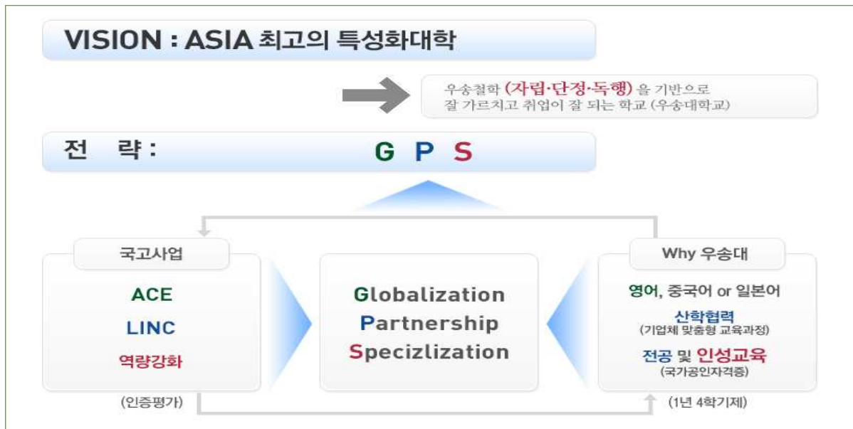
[그림 1. 우송대학교 비전과 전략]

우송대학교의 건학이념인 ‘자립· 단정 · 독행’과 아시아 최고의 특성화대학을 만들기 위한 전략 GPS(Globalization, Partnership, Specialization)에서 Specialization의 ‘인성교육’을 전담, 우송대학교의 비전과 전략을 실천하는 역할을 담당한다.