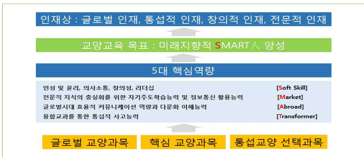
[그림 2. 우송대학교 교양교육원 교양교육 목표]

이러한 인재상 구현을 위해 인성 및 윤리, 의사소통, 창의성, 리더십 역량(Soft Skill), 전문적 지식의 충실화를 위한 자기주도학습능력 및 정보통신 활용능력(Market), 글로벌시대 효율적 커뮤니케이션 역량과 다문화 이해능력(Abroad), 지역사회에 대한 이해와 봉사를 통한 지역사회 발전과 개선능력(Region), 융합교과를 통한 통섭적 사고능력(Transfermer)이라는 5대 핵심역량을 갖추도록 교양과정을 운영하여 미래지향적 SMART 人을 양성하는데 진력을 다하고 있다.