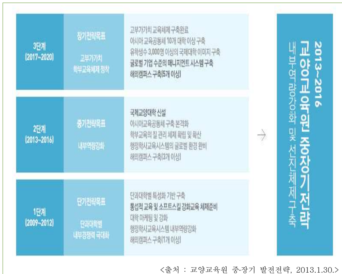
[그림 3. 우송대학교 중장기발전 단계와 교양교육원의 중장기전략]